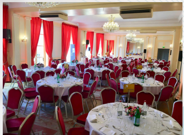
Dîner Horizon Chimie, Maison de l'Amérique Latine

Ce sont une cinquantaine d'étudiants de l'ESCPI, Chimie Paris, l'ENSIC et l'ECPM qui organisent chaque année ce forum. Chaque membre se tient à votre disposition pour répondre à vos interrogations.