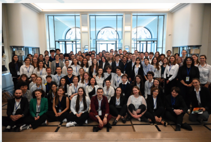
L'équipe FHC 2023