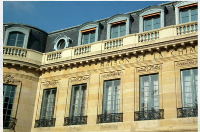
Maison de la Chimie, Paris

Ces échanges s'organisent autour des stands, mais également au travers de conférences et, le soir, d'un dîner. Ils vous permettront de promouvoir vos offres de stages, d'alternance et d'emploi.